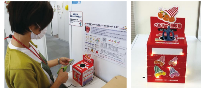
④仕分け・集計をするハピネス推進室の皆さん ⑤⑥回収箱にはさみをつないでいる ⑦⑧「ベルマーク大使」がライトアップしてくれた