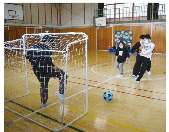
昨年度の支援先から届いた、備品を活用している写真

このような支援は、子どもたちを思い、ベルマークを集めて送ってくださる皆さんの活動があって成り立っています。財団はこれからも、全ての子どもたちが等しく笑顔で学べるよう、支援を続けていきます。