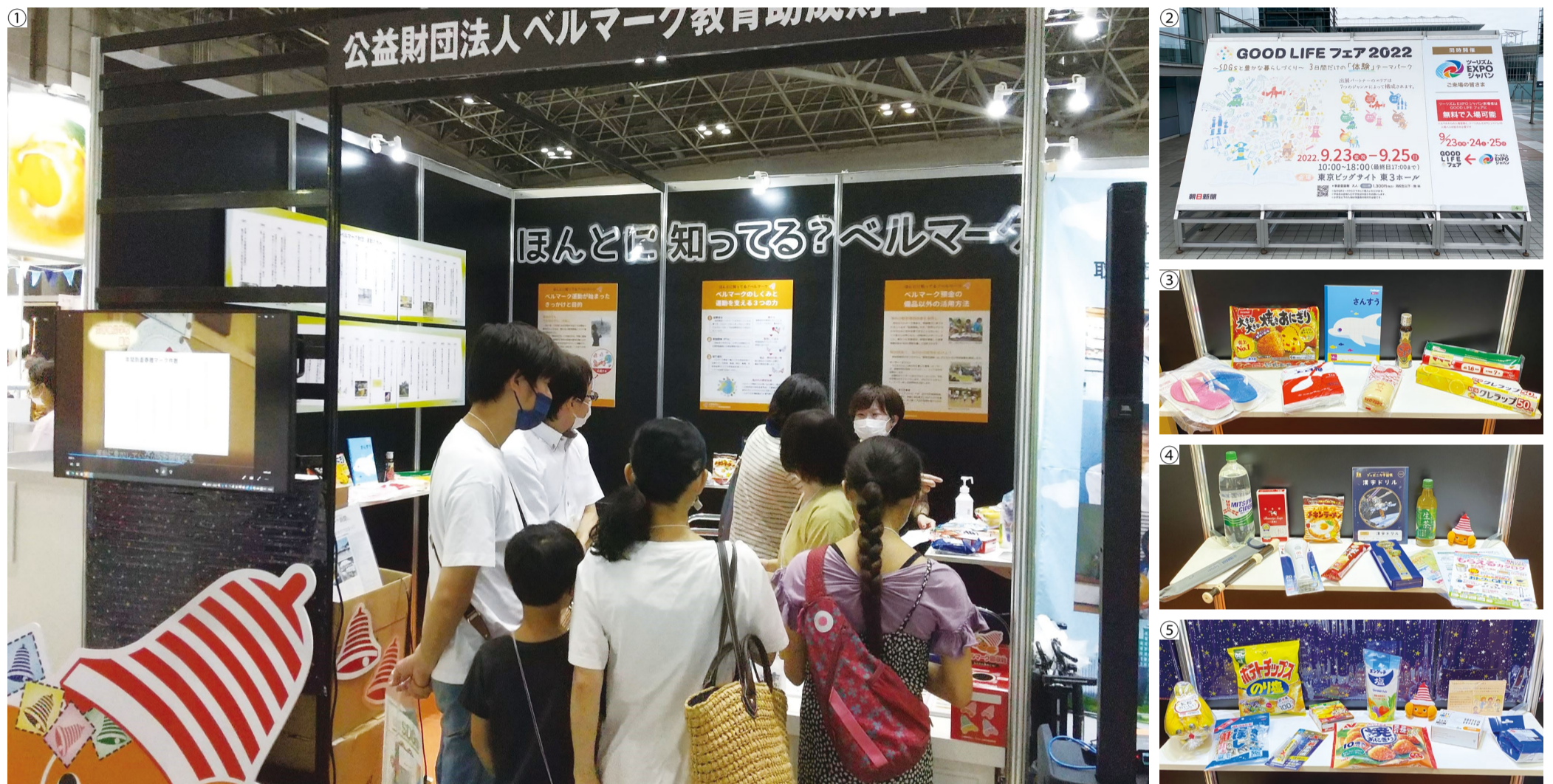
①来場者でにぎわうベルマーク財団のブース ②東京ビッグサイト入り口に設置されたフェアの案内 ③④⑤協賛会社が提供してくれたベルマーク付き商品の展示は大好評だった

東京・有明の東京ビッグサイトで9月23～25日に開かれた「GOOD LIFEフェア2022」(朝日新聞社主催)に、ベルマーク財団がブースを出展しました。このイベントは、SDGsに取り組む企業・団体の活動を知ること、「GOOD LIFE(心地よい豊かな生活)」に結びつく身近な選択肢に出あうことができるというコンセプトで開催され、3日間でのべ2万人近くが訪れました。