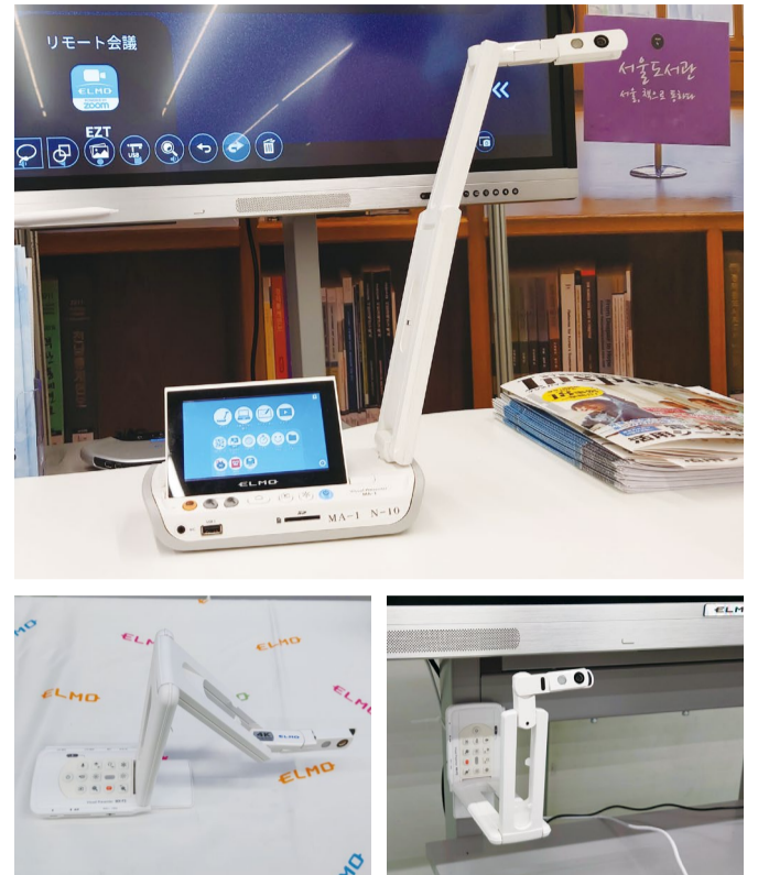
④完全ワイヤレス可動式書画カメラMA-1 ⑤モバイル書画カメラMX-P3 ⑥⑦本体底部のマグネットを使えば黒板などに固定できる

テクノホライズンは、この2種類以外にもさまざまな特長をもつ書画カメラを販売しています。製品の詳細は、エルモカンパニー(TEL:03-3471-4577)まで。