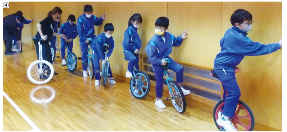
①②③静岡・浜松市立熊小で ④岐阜・高山市立本郷小で

ベルマーク財団のへき地支援ソフト事業、一輪車講習会が今秋、再開しました。昨年度はコロナ禍のため全面中止となりましたが、感染対策を十分に取って再スタートしました。