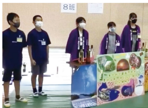
⑤宮崎・五ヶ瀬町立三ヶ所小 ⑥宮崎・延岡市立方財小（いずれもオンライン配信）