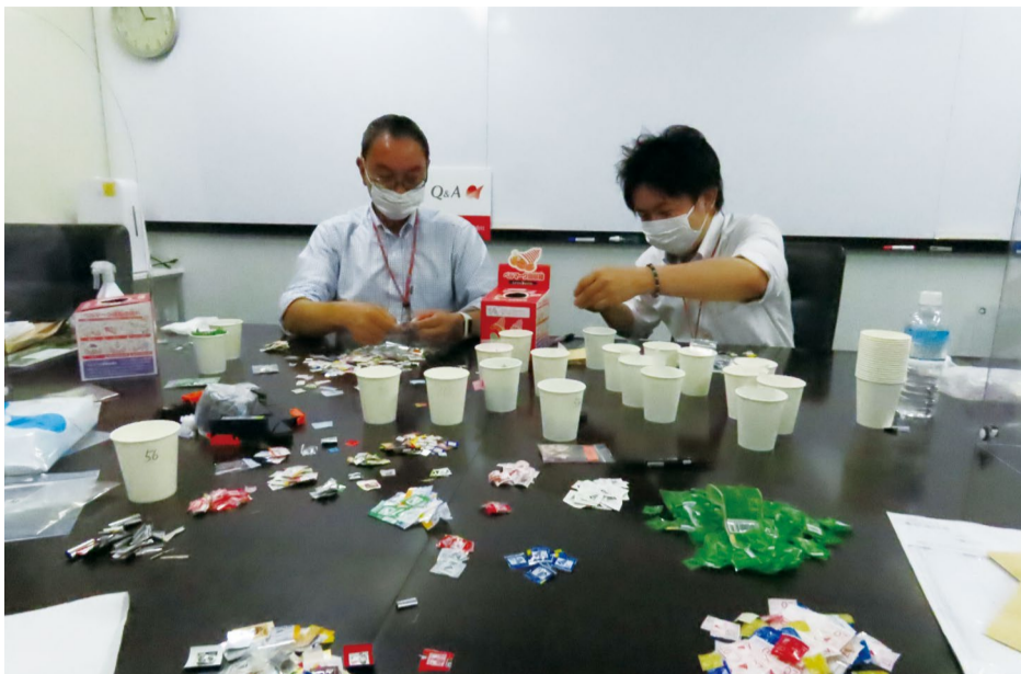
⑥仕分けには紙コップを活用。BGMをかけながら和やかな雰囲気で行われた ⑦仕切り板を使ってコロナ対策もばっちり ⑧会話を楽しむ時間もあった一方、無言で黙々と仕分けに集中した時間もあり、メリハリを意識したそう

ら集まった5人が担当しました。ハピネス推進室は従業員内の「幸福度」を高めるために昨年4月に設置された組織です。5人は、2日間の作業日を定め、集中的に取り組みました。