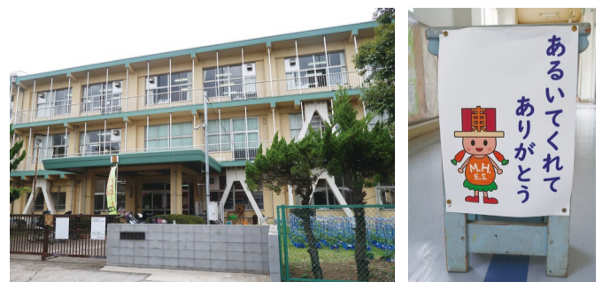
④幕張東小でのベルマーク贈呈式 ⑤⑥幕張東小 ⑦⑧学校のキャラクター「キャラミー」は地元名産のニンジンがモチーフ