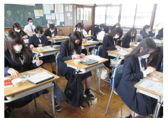
⑤みんなでピース！いい笑顔です ⑥④各クラスから2人ずつ選出される宗教委員が運動の概要を説明 ⑦⑦集中して仕分けに取り組んでいることが伝わってきます