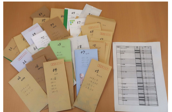
④亀山小の子どもたちが仕分けたマーク