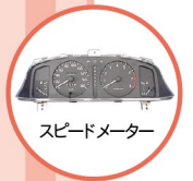
スピードメーター