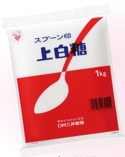
Spoon logo 上白糖 1kg、500g、400g