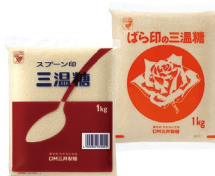
Spoon logo と Rose logo 三温糖 1kg、500g、400g