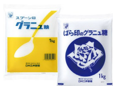
Spoon logo グラニュー糖 1kg、500g、400g