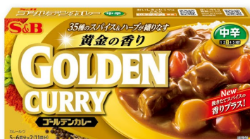
ゴールデンカレー スパイス&ハーブが効いた 香り高い本格的なカレー