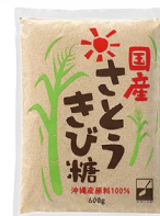
国産さとうきび糖 600g