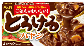
とろけるハヤシ こだわり素材のうまみで ごはんがおいしい