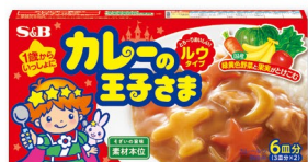
カレーの王子さま ルウタイプ まるやかでやさしい味わい