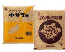
Spoon logo と Rose logo 中ザラ糖 1kg、500g、400g