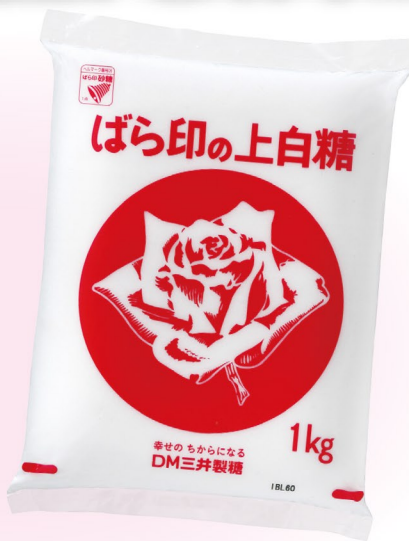
Rose logo 上白糖 1kg、500g、400g