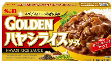
ゴールデンハヤシライスソース 香り豊かなスパイスと トマトの旨み