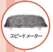
スピードメーター