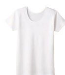
三分袖スリーマー