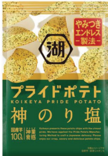
●湖池屋プライドポテト