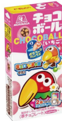
チョコボール 〈ピーナッツ〉〈キャラメル〉〈いちご〉