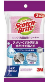
スコッチ・ブライト™ シンク・洗面台用 クリーナー