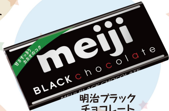
明治ブラック チョコレート