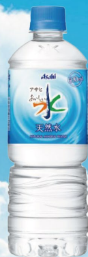
アサヒおいしい水 天然水 自販機用 PET600ml