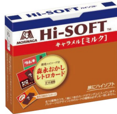
ハイソフト〈ミルク〉