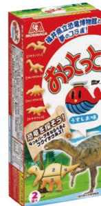
おっとっと 〈うすしお味〉