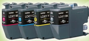
5点 使用済み インクカートリッジ

(対象はプリビオ、マイミーオ、ジャスティオの使用済みインクカートリッジ、トナーカートリッジ、ドラムユニットです。)