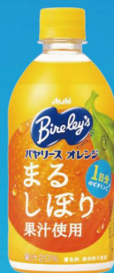
バヤリースオレンジ PET470ml