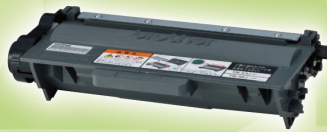
50点 使用済み トナーカートリッジ