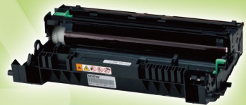
50点 使用済み ドラムユニット