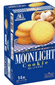
ビスケット マリー・チョイス・ムーンライト