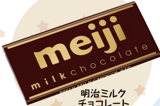
明治ミルク チョコレート