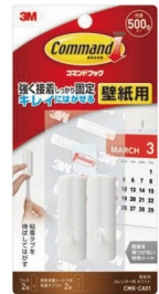
コマンド™ フック 壁紙用