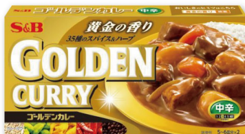
ゴールデンカレー スパイス&ハーブが効いた 香り高い本格的なカレー