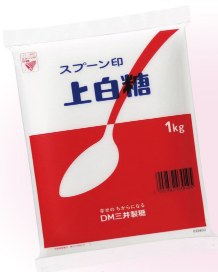
スプーン印上白糖 1kg、500g、400g