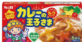
カレーの王子さま ルウタイプ まるやかでやさしい味わい