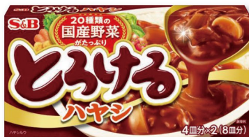
とろけるハヤシ 国産野菜がとけこんだ 濃厚でなめらかなコク