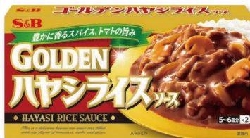
ゴールデンハヤシライスソース 香り豊かなスパイスと トマトの旨み