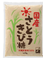
国産さとうきび糖 600g