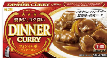
フォン・ド・ボー ディナーカレー 「フォン・ド・ボー」の 深いコクと旨み