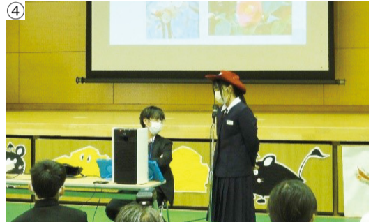
備品を活用している写真が続々と届いている ①三島村立三島大里学園(鹿児島県) ②徳之島町立亀徳小学校(鹿児島県) ③函館市立南茅部小学校(北海道) ④高崎市立倉淵中学校(群馬県)

ベルマーク財団が今年度支援したへき地学校から、感謝のメッセージが続々と届いています。