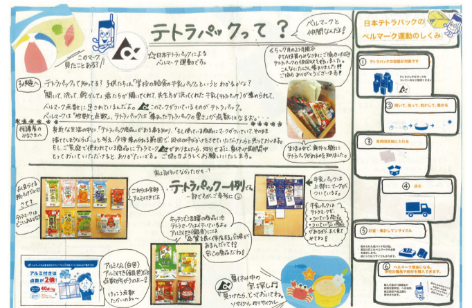
優秀賞を受賞した神奈川県逗子市立沼間小の作品。この号ではテトラパックを特集して、協力を呼びかけている