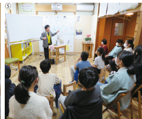
①子どもたちの輪に、あっという間に溶け込んだ尾木直樹さん。子どもと一緒にマシュマロを焼いた ②尾木さんを囲んで「はい、ポーズ！」 ③笑顔で子どもたちに語りかける尾木さん ④手作りの図鑑を手渡した低学年の子どもたち ⑤テレビなどでも活躍する尾木さんを目の前にして、子どもたちの目は輝いていた

「なかなかややこしい時代になったわよね。その中でもみんな元気に遊んで。感心しちゃう」