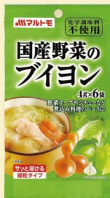
「国産野菜のブイヨン」 4g×6袋