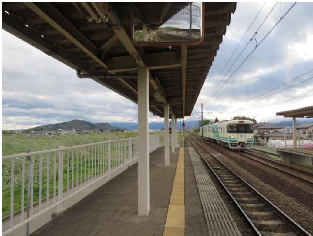
阿武隈急行線『瀬上駅』