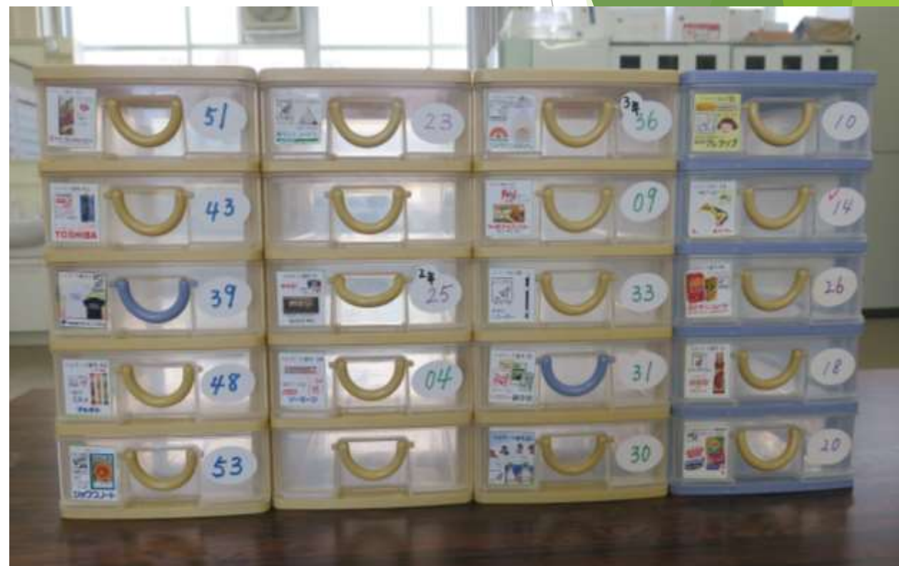
企業別回収ボックス