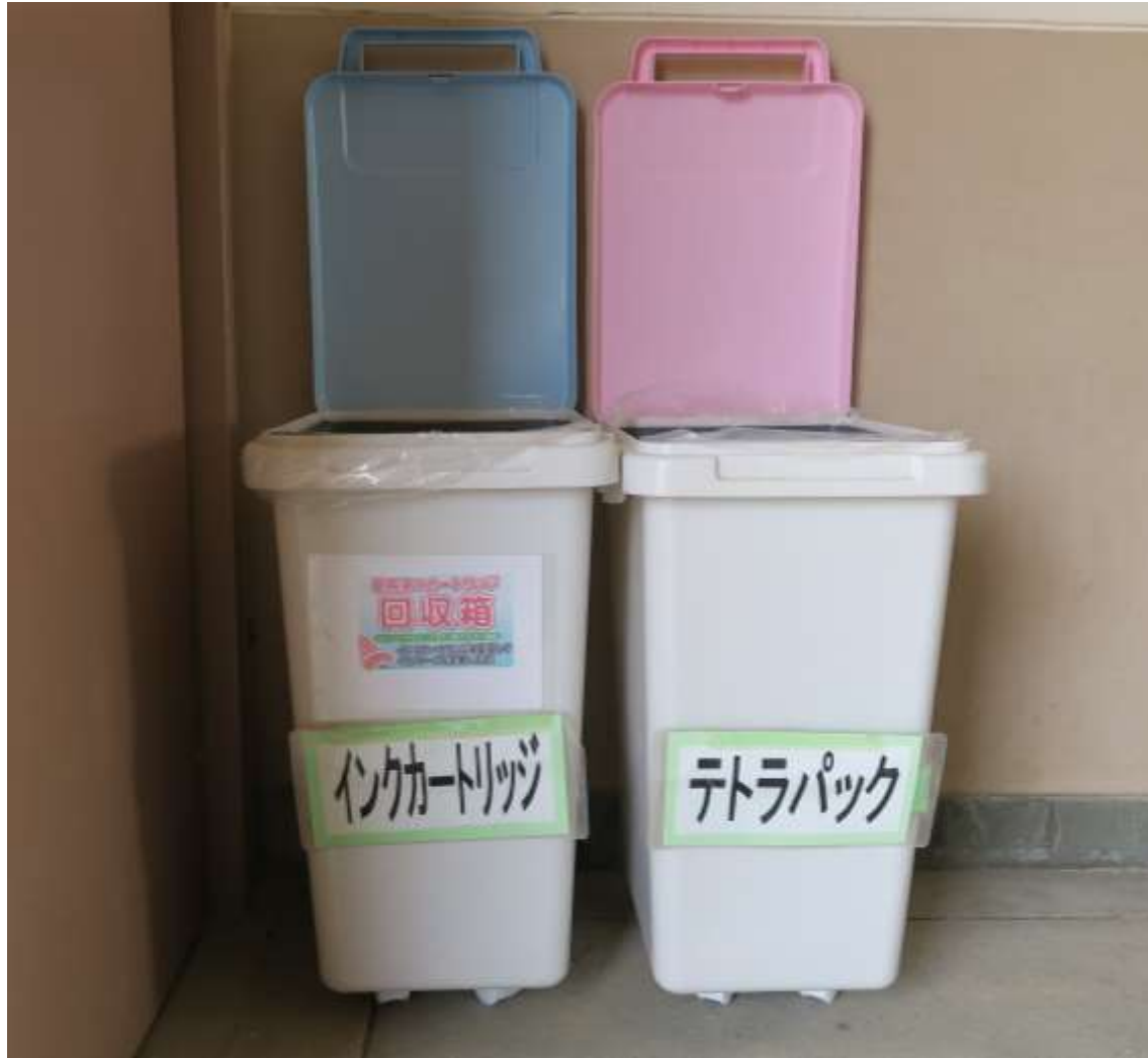
校舎1階に設置しているテトラパック・インクカートリッジ回収箱