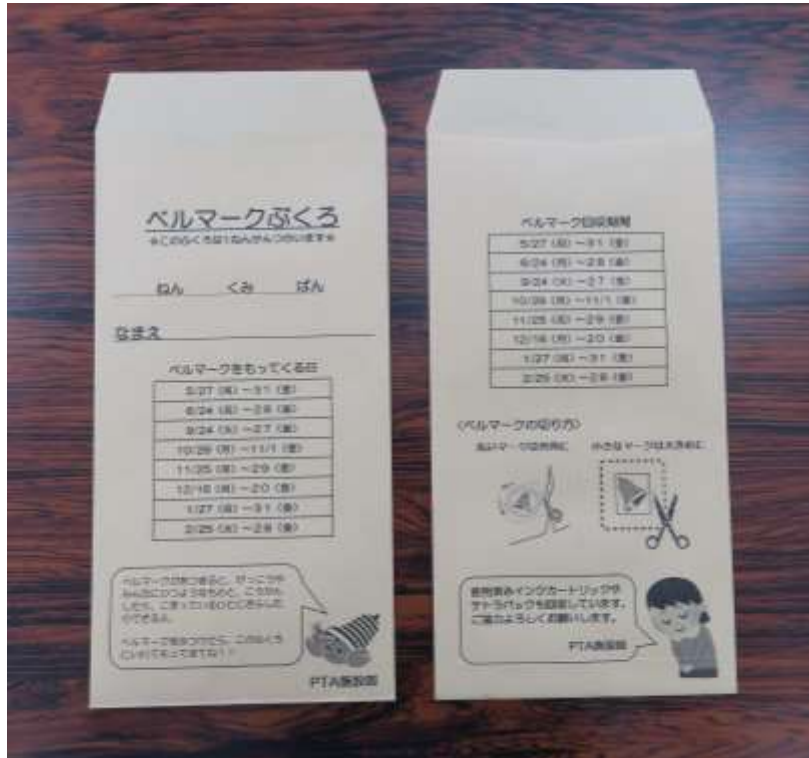
ベルマーク回収袋