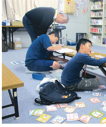
寺子屋で子どもたちが学習支援を受けている様子

東日本大震災の被災地で、学校では対応しきれない子どもたちの放課後の学習支援を居場所づくりをする「寺子屋」事業