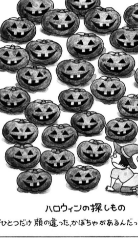
ハロウィンの探しもの「ひとつだけ顔の違ったかぼちゃがあるんだって……?!」