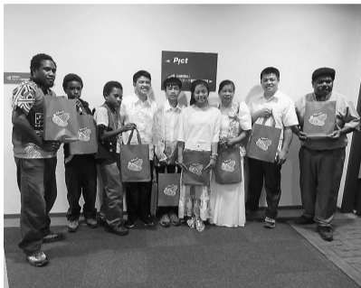
ベルマーク財団を訪れたフィリピンとパプアニューギニアの子もたちと現地スタッフと通訳の皆さん

アジア太平洋地域を中心に36の国・地域で「子供の森」計画を進める公益財団法人オイスカ(本部・東京都杉並区)の担当者と