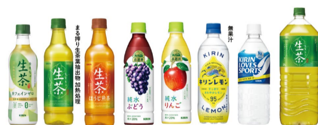
※カフェインについては、0.001g(100ml当たり)未満をカフェインゼロ(0g)としています。

専用台紙はキリンビバレッジHP( https://www.kirin.co.jp/area/kinin_okinawa_bellmark/ )からダウンロードできます。