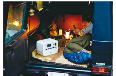
ポータブル電源の活用イメージ

「ポータブル電源 PS720AA-W ホワイト」は約9.5kgの重さで電力をコンパクトに持ち運べる商品です。価格は91,800円(税別)。