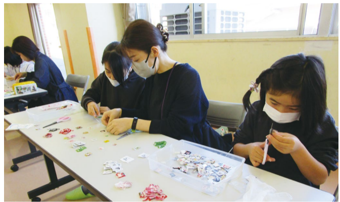
「ちょボラ隊」の名前の由来は、「ちょこっとボランティア」

「ちょボラ隊」の活動は今年で19年目。これまでに、使用済切手の回収運動、高齢者施設でのハンドベル演奏など様々な活動をしてきました。