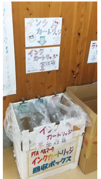
⑦⑧ベルマークポケットにマークを入れる児童 ⑨寒川真木子さん ⑩回収ボックスの案内にもイラストが描かれている