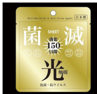
「菌滅シート（光触媒）」

用途によって、「液晶画面用」「光触媒」の2種類があります。「液晶画面用」は指紋汚れを防止する効果のあるシートです。「光触媒」は、光触媒技術により太陽光、蛍光灯、白色LEDなど明るい場所で効果があるだけでなく、暗い場所でも暗所応答型光触媒が抗菌力を発揮するシートです。教室ごとに適した対策ができるよう、4つのセット商品があります。内容は「菌滅シート（液晶画面用）」、