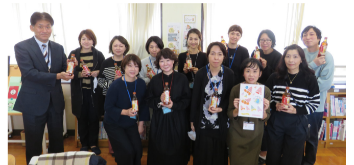
④整理棚を設置し、仕分けに協力してもらおう ⑤昨年10月にはベルマーク預金でパドミントンラケットを購入 ⑥PTA文化部の皆さん。後列左は長町校長。キリンビバレッジの「生茶 ほうじ煎茶」を持って