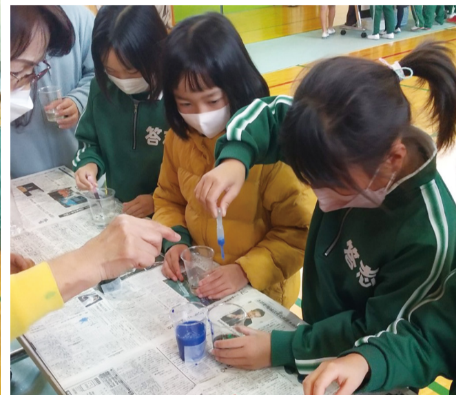
⑤ペンシルバルーンを使った実験は、「自分もやってみたい!」という子が続出 ⑥⑦水の入ったペットボトルを使った実験 ⑧⑨ワークショップにも真剣に取り組んだ

三重県の鳥羽市内から定期船に乗って約20分。答志島は鳥羽市最大の離島で、伊勢湾の入り口に位置します。