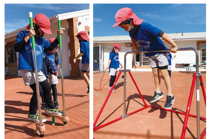
昨年度の支援先、アメリカの西大和学園カリフォルニア校

今年度は、全国のへき地学校100校、特別支援学校45校、海外の日本人学校4校に希望の備品・教材を、岩手・宮城・福島3県の東日本大震災被災校112校には希望の備品やバス代を、4つの院内学級にはタブレット類などを届け、計265校を支援することができました。皆さんのご協力があって、毎年継続した支援を実現できています。ありがとうございます。