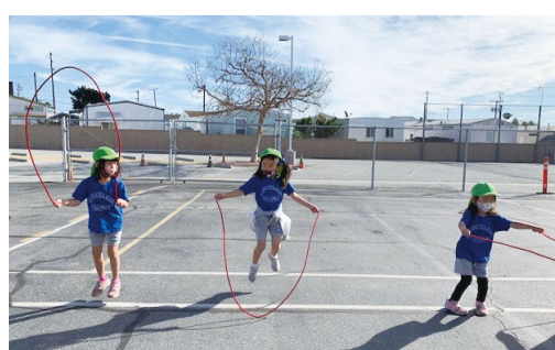
西大和学園カリフォルニア校