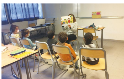
モンペリエ日本語補習授業校