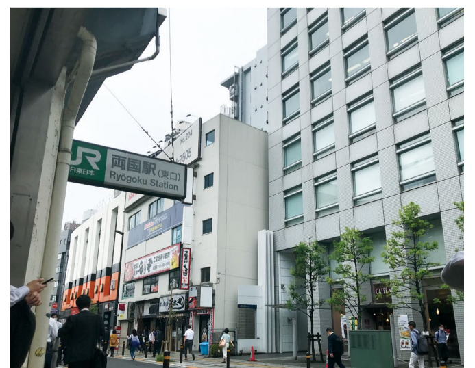
右が財団の入居するビル。JR両国駅東口のほぼ正面です

両国は、大相撲の興行が実施される国技館で有名ですが、そのほかにも江戸東京博物館や北斎美術館など、立ち寄りに適した名所がたくさんあります。コロナ禍が続くうちはなかなか難しいとは思いますが、アフターコロナの世界が実現した折には、ぜひ財団見学を兼ねて、両国に遊びに来てみてはいかがでしょうか。そうした日々が早く訪れることを願っています。