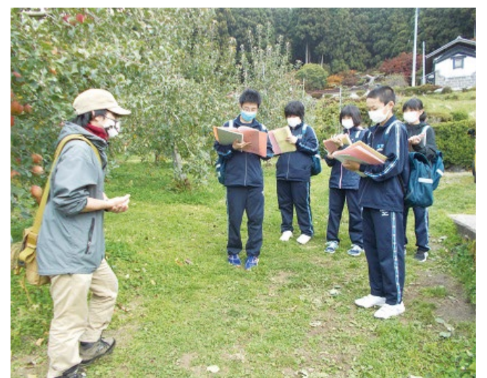
財団が支援したバス代を活用して現地調査する中学生

ベルマーク運動は、お買いものをするすると購入額の1割が自動的に財団に寄付されます。コロナ禍にもかかわらず、子どもたちのためにと、ベルマークを集めて送ってくださるみなさんの活動が、こうした支援を実現する力になっています。「すべての子どもたちに等しく質の高い教育を」という願いを込めて、財団では今後もハンディのある学校を支援し続けていきます。