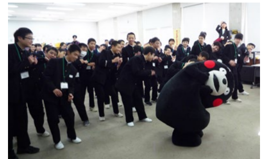
④不知火火をバックにみんなで記念撮影 ⑤⑥真剣なまなざし ⑦⑧クリスマスに頑張る中学生のためにくまモンがサプライズで登場

「中学生九州サミット in みなまた ~我が地域に勇気の一步を!~」が、熊本県芦北町の「あしきた青少年の家」で12月22日から25日に開催されました。熊本県・水俣市・福島県・福島市・郡山市・伊達市・国見町の各教育委員会が後援しました。