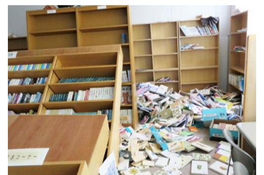
④はじけたポーズをとってくれた早来中の生徒たち ⑤プレハブの仮設校舎 ⑥被災直後の旧校舎内。図書室では本棚が倒れた