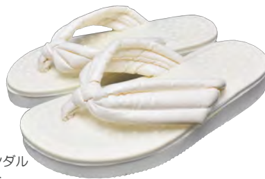
スクールサンダル ホワイト