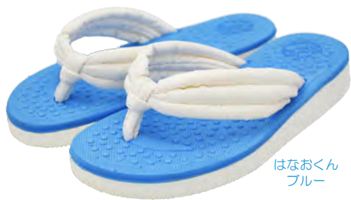
はなおくん ブルー