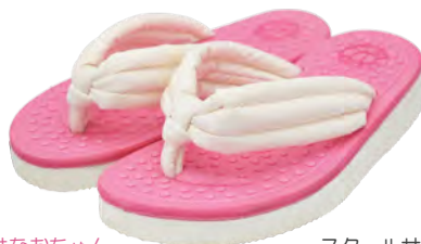
はなおちゃん ピンク