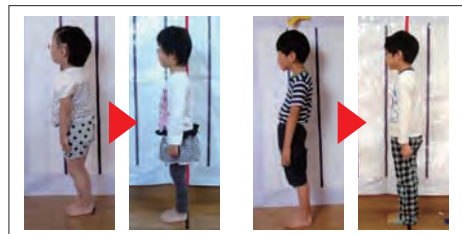
草履サンダルによる姿勢変化