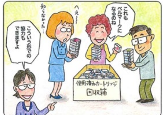
ベルマーク教育助成財団HPより

3社の純正品のみが対象です エプソン・キャノンは未使用のカートリッジも回収しています