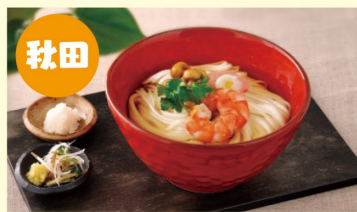
秋田 稲庭うどん3箱セット

日本人なら懐かしさと味わいを感じずにはいられない、沢山の幸せが詰まった東北地方。そんな東北の魅力を詰め込んだご当地グルメをお届け。 ※画像は掲載商品の一例です。