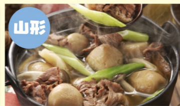
山形 いも煮カレーうどんの素