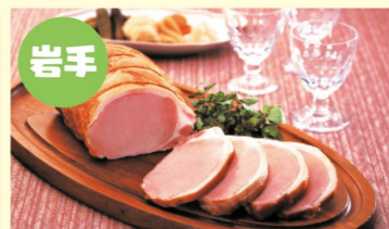
岩手 ハムギフトセット