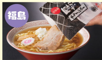
福島 喜多方ラーメン6食