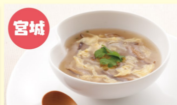
宮城 濃縮ふがひれスープ