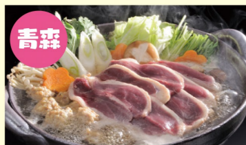
青森 青森県産鴨鍋セット