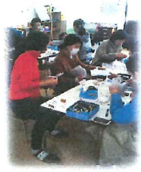
集計作業の様子です

先日2月19日（水）にベルマーク集計作業を実施しました。インフルエンザや新型コロナウイルスの流行でなにかと気忙しい中、係の人を含め10名以上の方が参加してくださいました。ベルマーク係の皆様をはじめ、ベテラン有志の方々のご協力により作業が順調に進み、予定より1時間程早く終了することができました。ご協力ありがとうございました。集計結果をベルマーク財団に送り、確定された点数が届き次第詳細をご報告させていただきますが、ひとまず、概算の集計結果を下記に報告いたします。