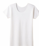
三分袖スリーマー