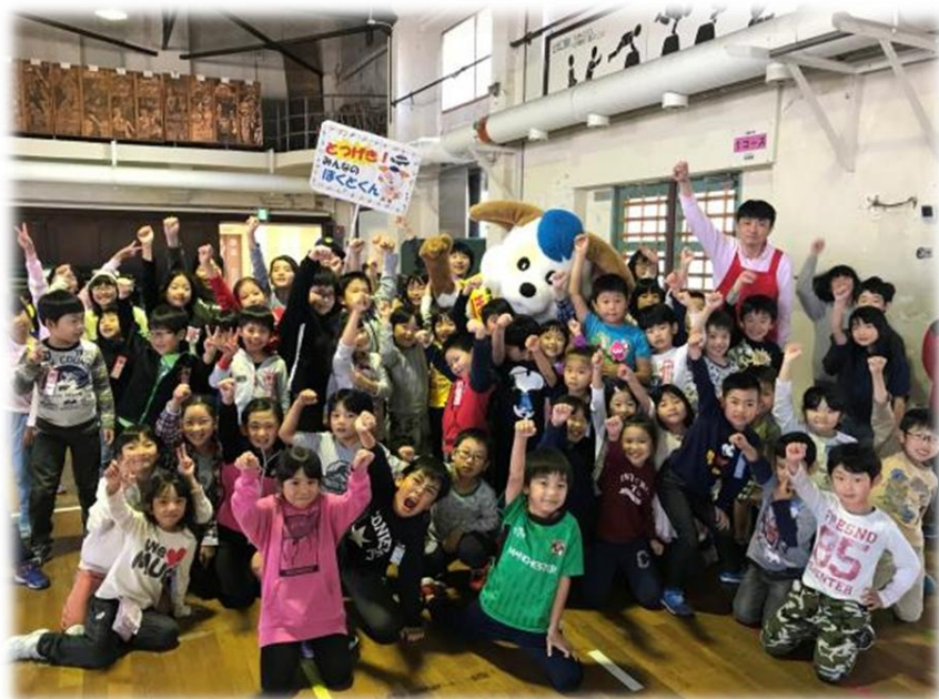
函館市西警察署との連携 「絆プロジェクト」「防犯活動」