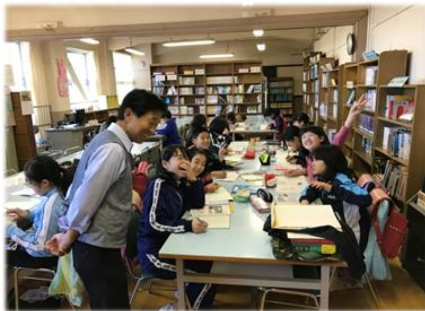
函館市学力向上支援事業 「アフタースクール」の運営