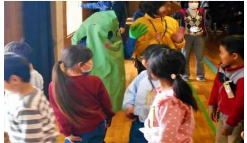
子どもたち自慢のビオトープ5年生が守っ ています！イメージキャラの ビオクーサー