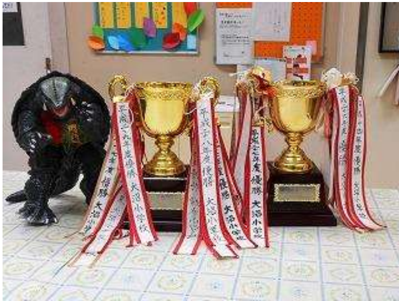
南部会では個人種目は勿論！ クラス対抗リレーでは全クラス優勝の快挙！