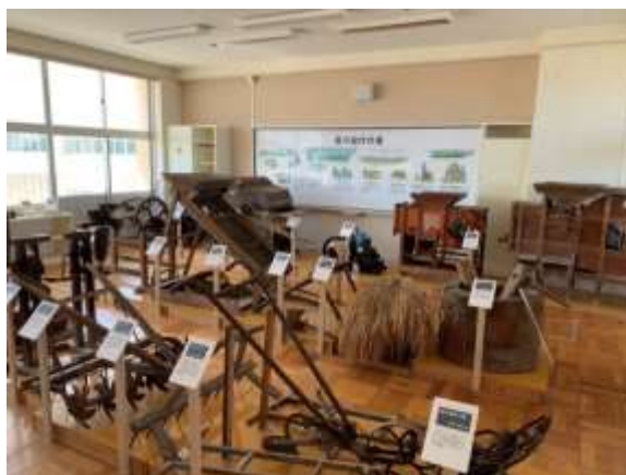
郷土室1 昔の農業展