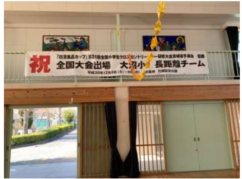
初出場で全国大会に。LD TEAM 全国大会では13位に！