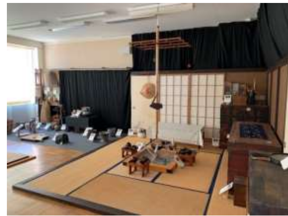
郷土室2 昔の暮らし展