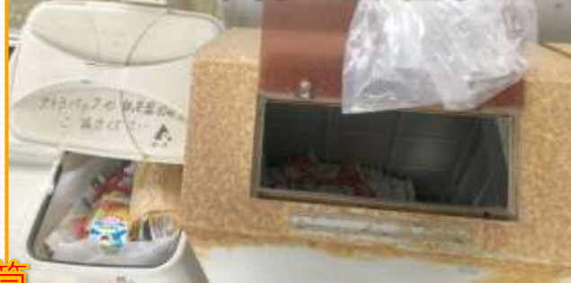
テトラパック・牛乳パック回収BOX