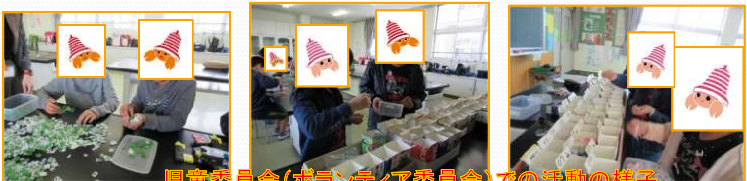
児童委員会(ボランティア委員会)での活動の様子

★ベルマークを子ども達が自ら仕分けできるような仕分けボックス（小分け引き出しになっているもの）を設置する。