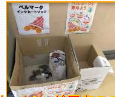
カートリッジ回収BOX