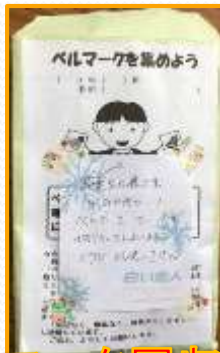
ベルマーク回収封筒