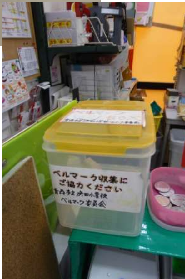
スーパーの サービスカウンター