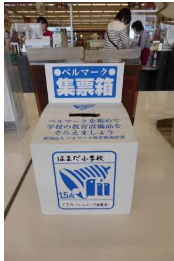
スーパーの袋詰め台