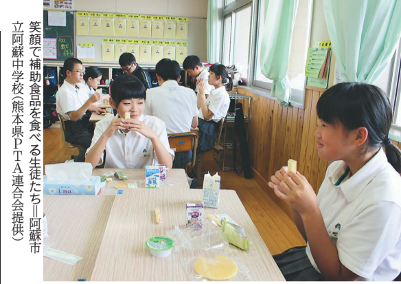
笑顔で補助食品を食べる生徒たち(阿蘇市立阿蘇中学校)